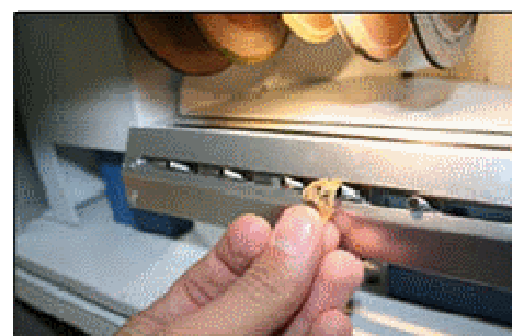
Capteur pour le déplacement de la caméra